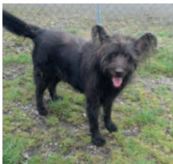
GORO, pes, 11 let, černý. Majitelka zemřela. Velmi dobrá kondice a moc hodný.

Psí útulek, ul. Brožíkova, Karviná-Darkov, tel.: 602 520 826