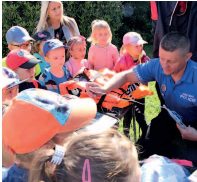
Dětem hrozí o prázdninách více úrazů – i na to strážníci pamatují a dětem na karvinských školách vysvětlují, na co si dát pozor.

Nevizujte svou nepřítomnost doma, radí. Chlubení se na facebooku či jinde veřejně, to není právě prozíravé: Už se těšíš k moři, budu tam 14 dní – a k tomu den, čas a vaše jméno... Podobné hlášky zní doslova jako pozvánka pro zloděje. Pozor také na to, co na sítě píšou vaše děti. „Zloději pak stačí jen chvíli sledovat Váš byt nebo dům, aby získal jistotu, že v něm opravdu nikdo není. Byt vám vykrade a ještě si v něm udělá piknik a co může, zničí,“ pokračuje zkušený strážník. Podle něho byste neměli o odjezdu informovat nijak veřejně a měli byste požádat sousedy či rodinu, aby vám občas zašli vyvětrat, rozsvítit, vybrat schránku nebo jinak dát okolí najevo, že váš byt mrtvý není.