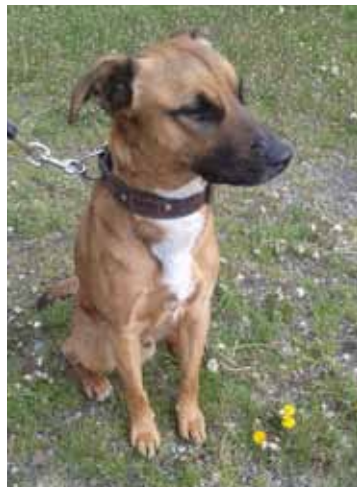
ARGO, pes, 2 roky, hnědý s bílou náprsenkou.