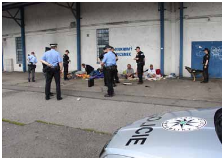
V polovině května proběhla velká akce v rámci projektu koordinované bezpečnosti. Strážníci a státní policie doslova vyčistili několik známých míst, kde se zdržují skalní bezdomovci a kde to obtěžuje veřejnost.

Městská policie Karviná se ve spolupráci se sociálním odborem magistrátu poměrně dobře daří eliminovat bezdomovectví ve městě. Za poslední roky se počet „bez nadějných“ případů radikálně snížil doslova na pár desítek. Strážníci získali před časem také starší sanitku a další zařízení potřebné k bezpečné přepravě problémových lidí například na záchytku nebo do nemocnic. Čas od času je ale nutné situaci znovu plošně ověřit a zasáhnout. Především tam, kde to nějaký čas obtěžuje veřejnost, protože je skupina problémových bezdomovců, kteří odmítají jakékoli pokusy o „normální“ život a nechtějí jít ani na ubytovny. Pak je na místě také spolupráce s Policií České republiky a systematické záahy. „Jen razantní, systematický a vytrvalý