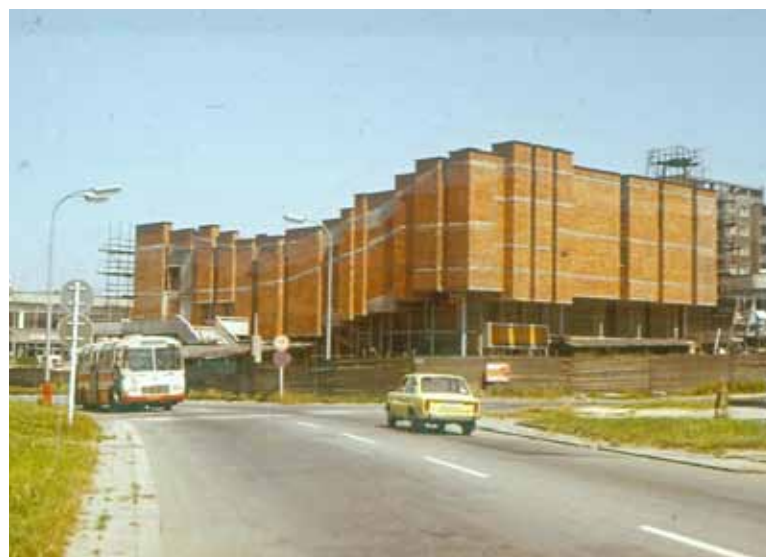
Kino po rekonstrukci a při výstavbě (starší foto – okresní archiv).