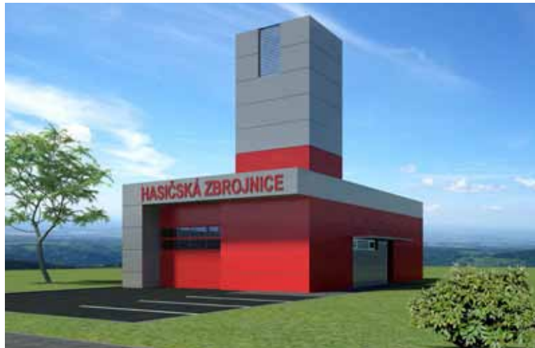
Takto by měla v budoucnu vypadat nová hasičská zbrojnici v Loukách.