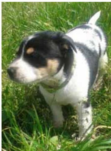
JESSIE, 6 týdnů, fenka, triolor.

Psí útulek, ul. Brožíkova, Karviná–Darkov, tel.: 602 520 826