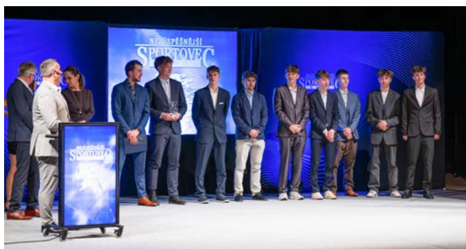
PŘEHLED OCENĚNÝCH SPORTOVců JE NA WEBU HTTPS://Z.KARVINA.CZ/SR2025