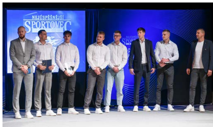
TÝM HCB KARVINÁ JE KOLEKTIVEM ROKU V KARVINÉ I V MORAVSKOSLEZSKÉM KRAJI