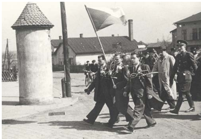
ČETNÍK DOHLÍŽÍ NA PRŮVOD, 30. LÉTA 20. STOLETÍ

Obvody prvních četnických stanic byly velmi rozlehlé. Do obvodu četnické stanice ve Fryštátě patřil nejen samotný Fryštát, ale také okolní obce od Petrovic přes Darkov, Louky, Karvinou až po Stonavu. Vzhledem k tomu, že na stanici sloužilo přibližně pět četníků, byla služba náročná, pestrá a nebezpečná. O tom svědčí případ z roku 1933, kdy ve Fryštátě a okolí došlo k sérii vyloupení obchodů a hostinců.