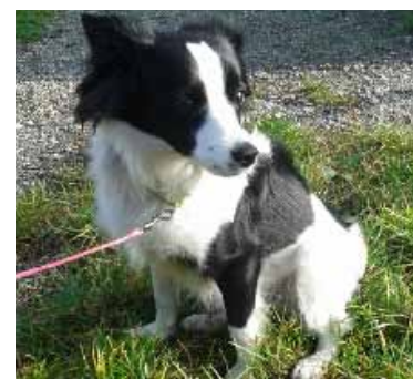
POLLY kříženec, 5 měsíců