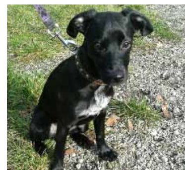
KUBA kříženec, 5 měsíců

Psí útulek, ul. Brožíkova, Karviná-Darkov, tel.: 727 869 211