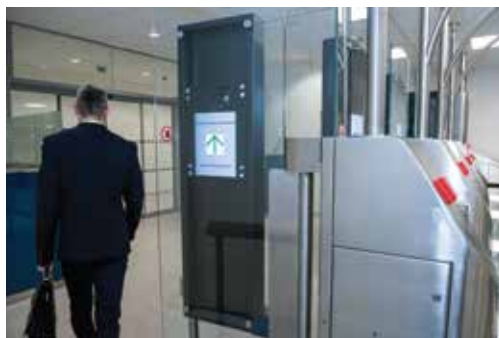
Úspěšné dokončení hraniční kontroly Successful completion of the border control

Provided that all the requirements for the self-service border control are fulfilled, the exit door opens and the system admits another passenger. Ideally, one traveler is checked every 14 seconds.