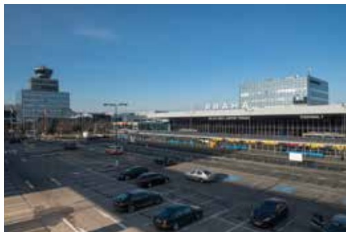
Hraniční přechod Praha Ruzyně na mezinárodním letišti Václava Havla Praha

Největším inspektorátem cizinecké policie je inspektorát na mezinárodním letišti Praha – Ruzyně, na němž vykonává službu více než 400 policistů. Tento inspektorát je členěn na skupiny a oddělení, kterými jsou oddělení vykonávající hraniční kontrolu, oddělení mobilního zásahu, skupina pro trestní řízení, územní oddělení, skupina pyrotechniků nebo skupina ochrany objektů zvláštního významu.