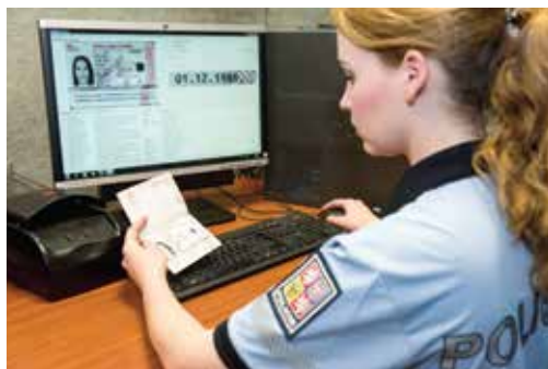
Policistka kontroluje pravost cestovního dokladu prostřednictvím celostránkové čtečky cestovních dokladů expertního optického systému

Police officer performing border check in border information system KODOX