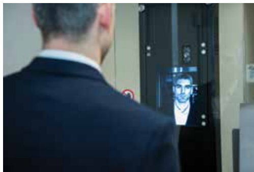
Pořízení obrazu tváře pomocí biometrické kamery Facial image acquisition with a biometrical camera

The information is subsequently cross-referenced against that located in the respective national and international police registers.