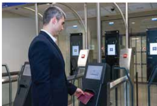
Systém EasyGO EasyGO system

A grant from the Norwegian Fund, within the “Program CZ14 - Schengen Cooperation and Combatting Cross-Border and Organized Crime, including Trafficking and Itinerant Criminal Groups” provided the incentive for modernizing the passport control system, both technical and technological. The project titled “The Enhanced Automated e-Passport Control System at International Airports (e-Gates)” extended the automated biometrical control system EasyGO and outfitted passport control stations with modern passport reading devices supplemented with respective expert systems.