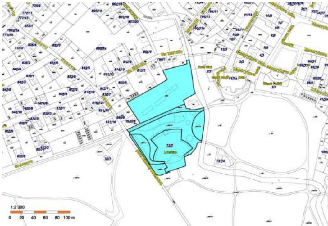
Mapa č. 3

Vymezení oblasti areálu Letního kina v parku Boženy Němcové v Karviné-Fryštátě