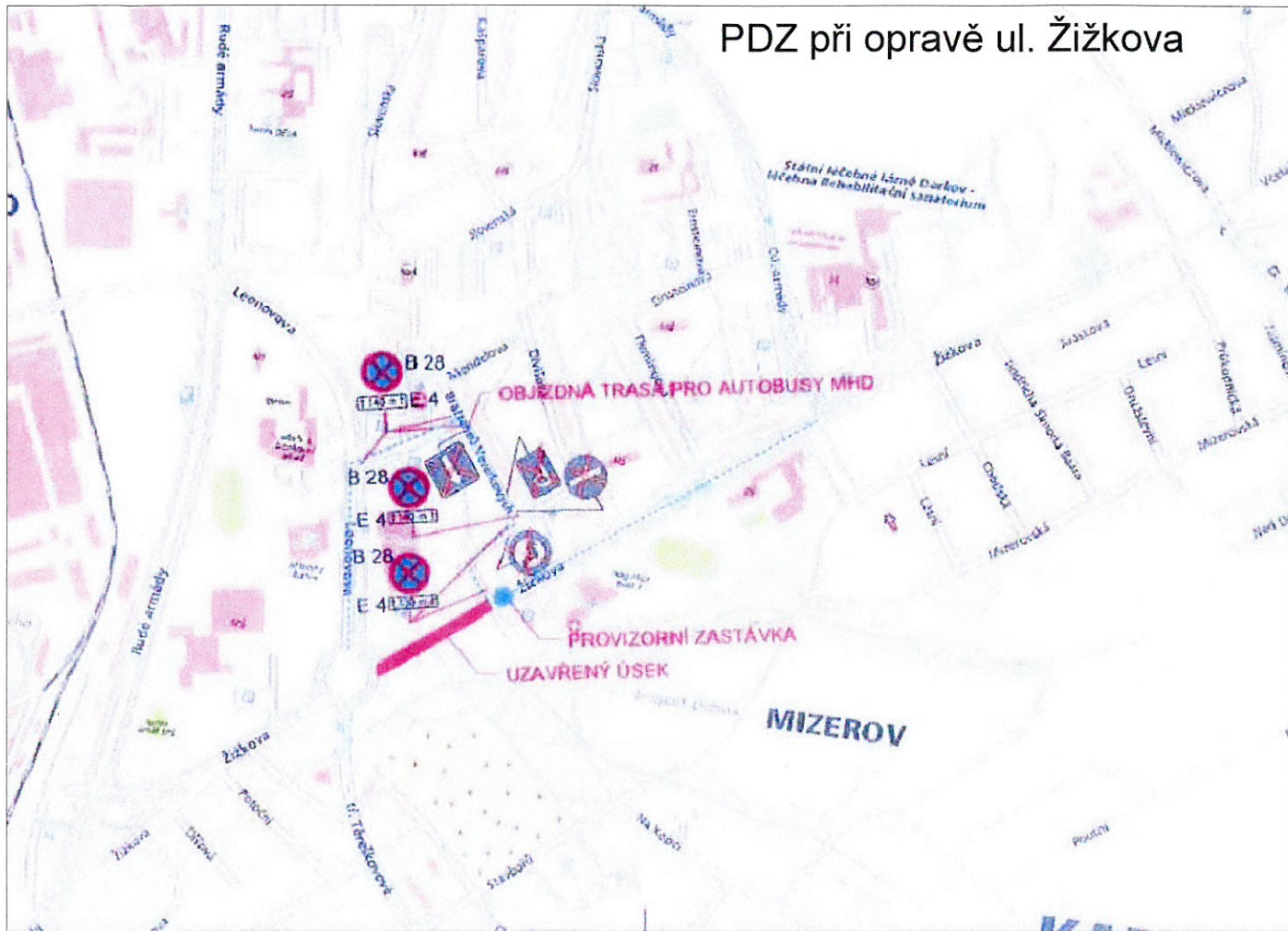
PDZ při opravě ul. Žižkova